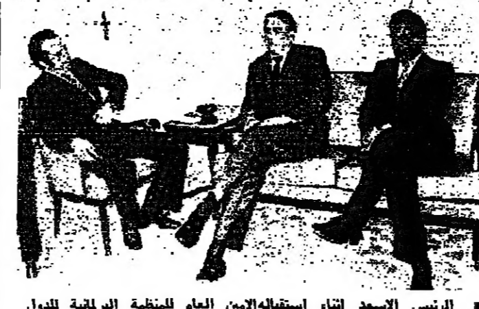
الرئيس الاسعد اثناء استقباله الامين العام للمنظمة البرلمانية للدول الناطقة بالفرنسية ، ويبدو النائب بلقيان

جرت اتصالات امس بين نقابة المحررين والرئيس رشيد كرامي ، بشأن منع سيارات المحررين من الوقوف في باحة السراي ، اصغر على الرها الرئيس كرامي تعليمات بالفاء المخكرة ، وذلك سهيلا للاعمال الصحية ، وحرصا على اقامة تعاون وثيق بين السلطة والصحافة .